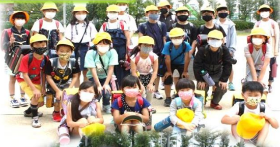
《Tステージの皆さん》