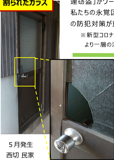
5月発生 西切 民家

豊田市は、空き巣などの「侵入盗」がワースト3位、車上荒らしなどの「自動車関連窃盗」がワースト2位と県内で多発している地域となっています。