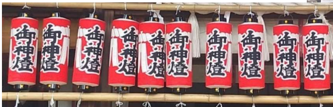
＜見違えるように鮮やかになった御神燈＞