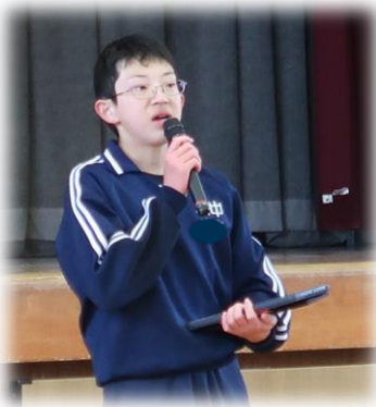
【実行委員長の思いとは…】

卒業に向けて、卒業プロジェクトの活動が進められています。5日（水）には、愛校活動が行われました。よりによって、特に寒い日になりましたが、それぞれの立ち位置で頑張る表情が印象的でした。