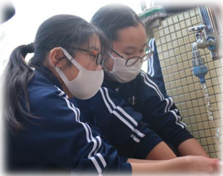
【水、冷たかったねえ】

数年前まで「愛校作業」だったものが数年前から「愛校活動」となりました。いくつかの学級では、授業の際に話しましたね。作業として、機械的にこなすのではなく、自分の思いをもって、工夫したり、よりよい方法を考えたりして取り組む、という「活動」にしようという考えがあったからです。