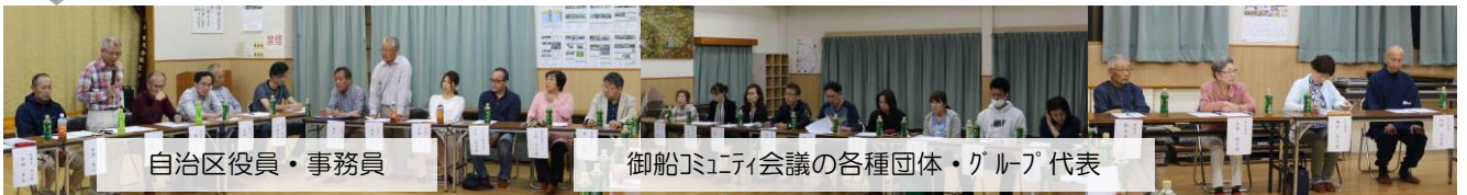
自治区役員・事務員