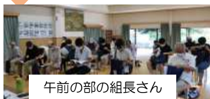
午前の部の組長さん