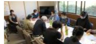
ふれあい祭 協力の各種団体の皆さん