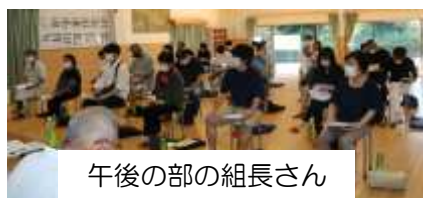
午後の部の組長さん