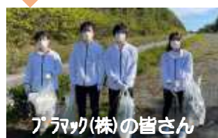
ファミック(株)の皆さん