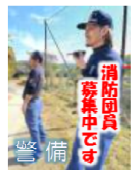
消防団員 募集中です 警備