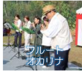
フルーツオカリナ