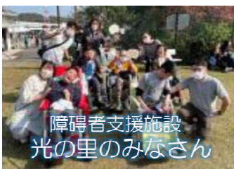
障害者支援施設 光の里のみなさん