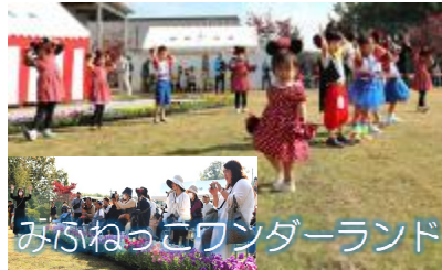
みふねっこワンダーランド