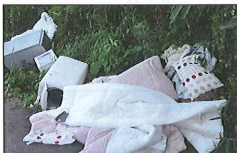
電化製品・寝具等が捨てられていました！

9月17日に滝40組内の道路沿いに、不法投棄が発見されました。18日に市役所、警察に連絡し、18日に豊田警察署の現場検証が行われた後、市役所の清掃課が処理しました。