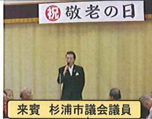
来賓 杉浦市議会議員