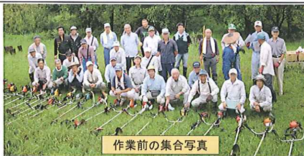
作業前の集合写真

9月7日(日)に愛護会による草刈がせせらぎ広場、前田公園、御船駅跡等で行われました。参加された皆様お疲れ様でした。