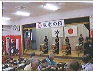
みふね太鼓クラブ