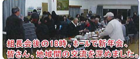
組長会後の18時、ホールで新年会。 皆さん、地域間の交流を深めました。

第4回は年度最後の組長会、これまでの自治区の活動を振り返っていただき、次年度に向けた改善点や地区の課題・問題点をお聴きしました。続いて新年会では地区間の交流・親睦をはかり、自治区の団結を強くしました。