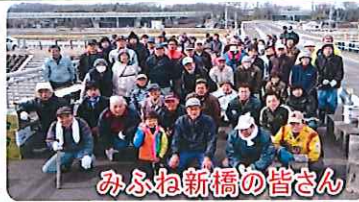
みふね新橋の皆さん