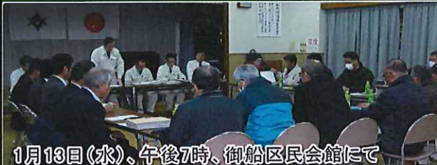
1月13日(水)、午後7時、御船区民会館にて 県豊田加茂建設事務所・維持管理課説明