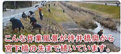
こんな作業風景が待井橋奥から宮下橋の先まで続いています。

雨天で1週延び、寒さがまだ厳しくても、多くの方が御船川各地区担当場所に集まり、作業の安全を確認し、草刈りやごみ取りを行っていただきました。御船川は真冬でもきれいに保たれています。参加された皆さん、ありがとうございました。