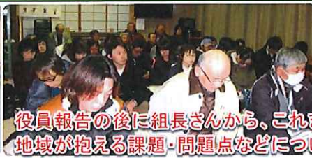
役員報告の後に組長さんから、これまでの自治区の活動や 地域が抱える課題・問題点などについて意見を交しました。