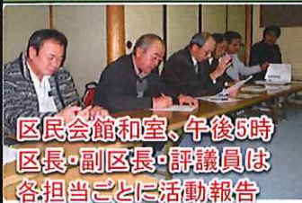
区民会館和室、午後5時 区長・副区長・評議員は 各担当ごとに活動報告